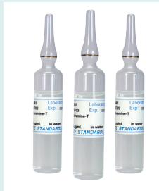
右: CL207 - 塩素スタンダード