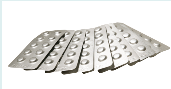
上: ExTabs 塩素試薬錠