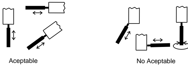
Figura 1 – Ángulos correcto e incorrecto para medición

Nota: La cabeza sensible con adaptador debe estar en línea con el objeto que se va a medir. Evite girar la cabeza sensora. Refiérase a la figura 1 a continuación.